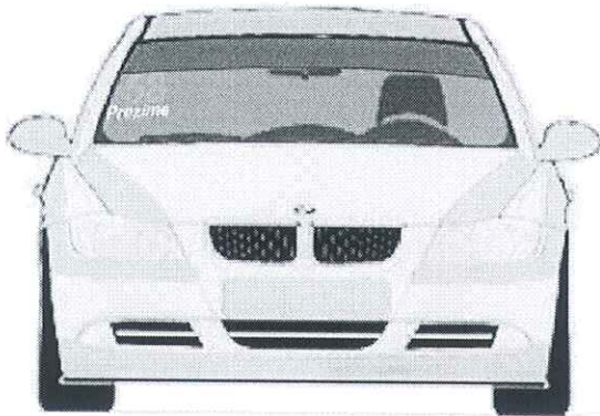
Prednjem vetrobranskom staklu. broj je visine 14cm sa debljinom linije od 2cm, font je Arial BOLD