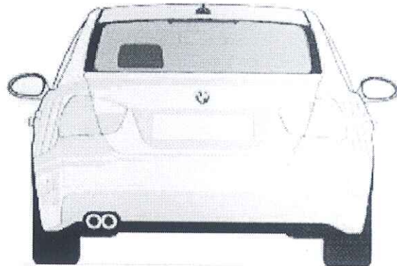
Zadnjem vetrobranskom staklu. broj je visine 14cm sa debljinom linije od 2cm, font je Arial BOLD