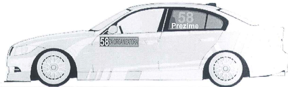
Zadnjim levim i desnim bočnim staklima, broj je visine 20cm sa debljinom linije od 2.5cm, font je Arial BOLD

Boja ovih brojeva je flourescentno narandžasta i to PMS 804