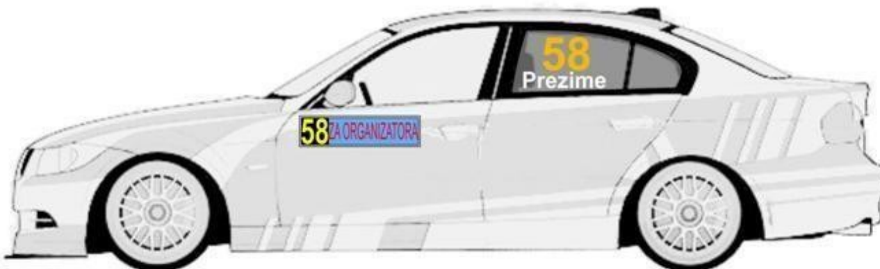
Zadnjim levim i desnim bočnim staklima, broj je visine 20cm sa debljinom linije od 2.5cm, font je Arial BOLD

Boja ovih brojeva je florescentno narandžasta i to PMS 804