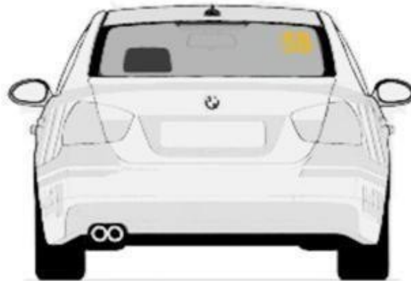
Zadnjem vetrobranskom staklu. broj je visine 14cm sa debljinom linije od 2cm, font je Arial BOLD