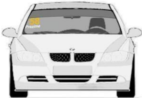
Prednjem vetrobranskom staklu. broj je visine 14cm sa debljinom linije od 2cm, font je Arial BOLD