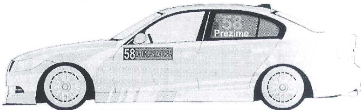
Zadnjim levim i desnim bočnim staklima, broj je visine 20cm sa debljinom linije od 2.5cm, font je Arial BOLD

Boja ovih brojeva je florescentno narandžasta i to PMS 804