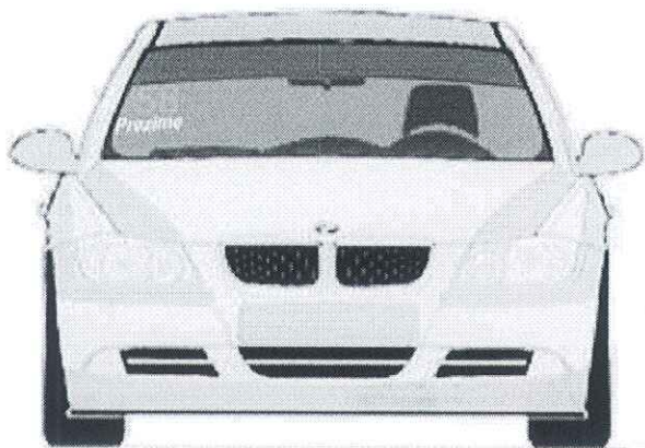
Prednjem vetrobranskom staklu, broj je visine 14cm sa debljinom linije od 2cm, font je Arial BOLD