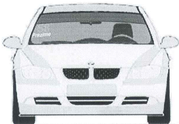
Prednjem vetrobranskom staklu. broj je visine 14cm sa debljinom linije od 2cm, font je Arial BOLD