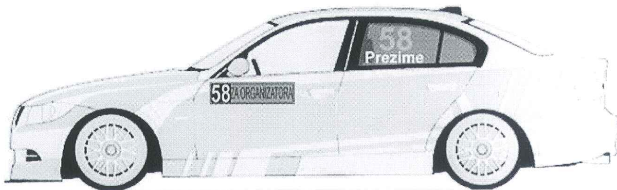
Zadnjim levim i desnim bočnim staklima, broj je visine 20cm sa debljinom linije od 2.5cm, font je Arial BOLD

Boja ovih brojeva je florescentno narandžasta i to PMS 804